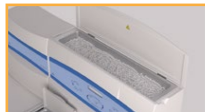
Capacidad de hasta 5 l