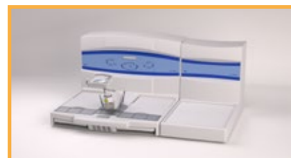
La placa fría puede posicionarse a la derecha o a la izquierda