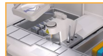
Dispensador con placa táctil o pedal de dispensación, luz y soporte portapinzas