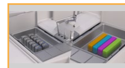
Bandejas extraíbles para almacenar los casetes y los moldes. La parafina sobrante se recoge en los cajones delanteros extraíbles.