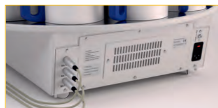
Filtro de carbón activo